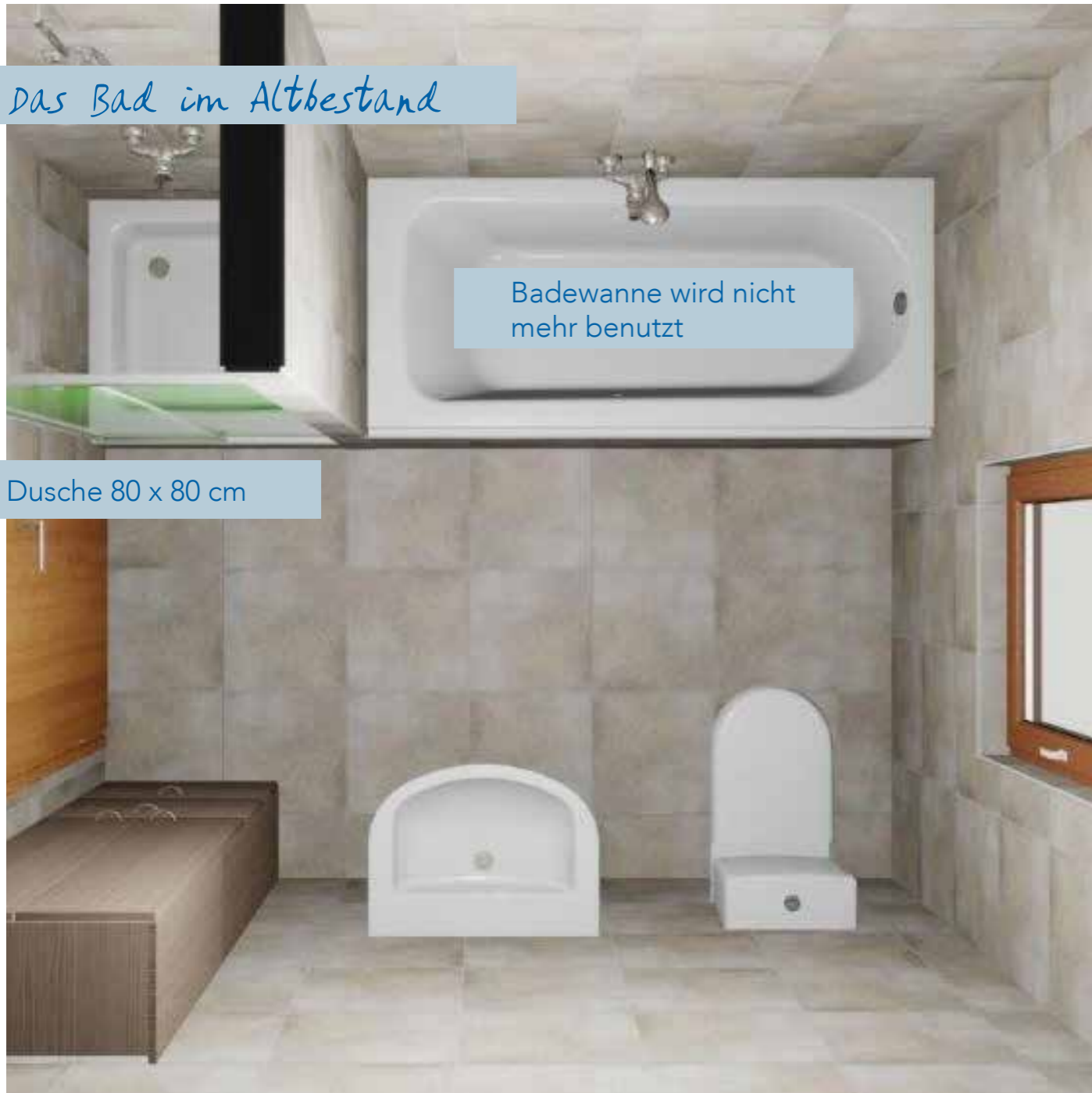
Dusche 80 x 80 cm